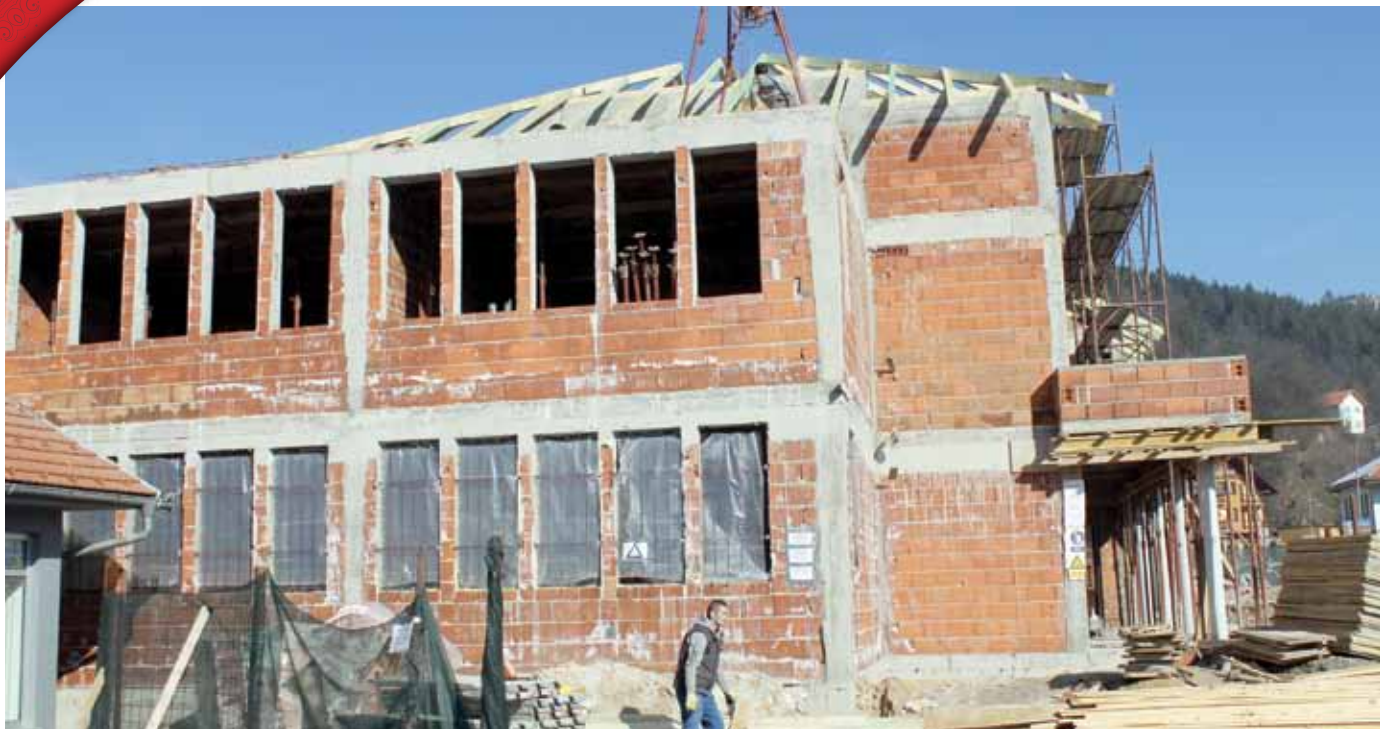
Zgrada suda u izgradnji