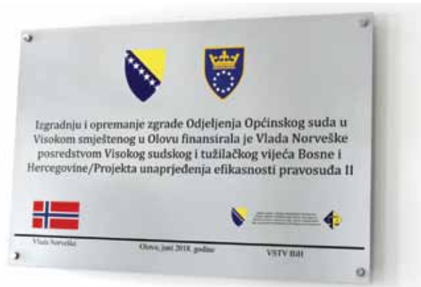
Nova tabla na ulazu