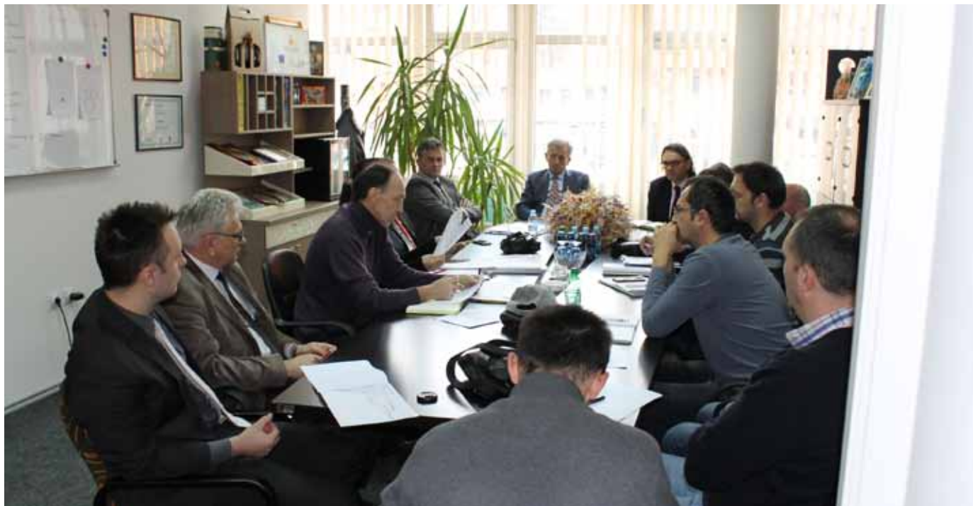
Sastanak upravnog odbora

VSTV BiH je u više navrata pokušao osigurati sredstva za izgradnju novog objekta. Sva nastojanja ostala su neuspješna do proljeća 2017. godine kada je, na inicijativu VSTV-a BiH, Vlada Norveške podržala prijedlog da se putem projekta „Unapređenje efikasnosti pravosuđa II” izgradi i opremi nova zgrada Odjeljenja Suda.