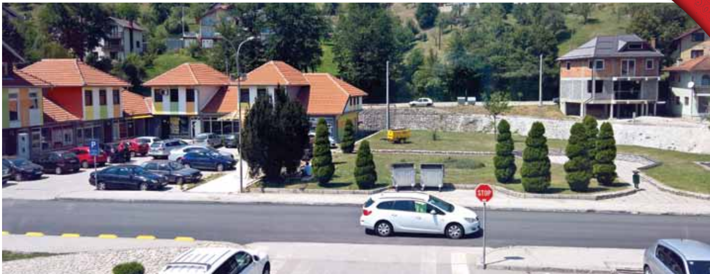
Lokacija - prije i nakon izgradnje