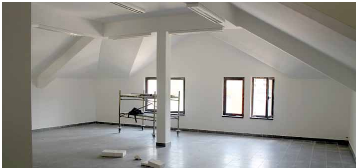
Arhiva - potkrovlje