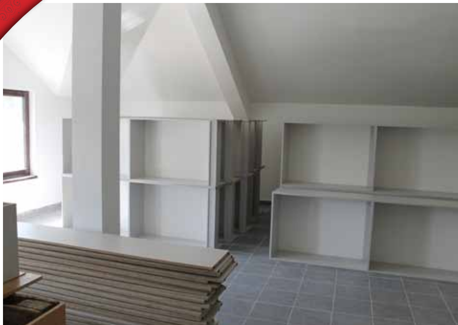
Arhiva - potkrovlje