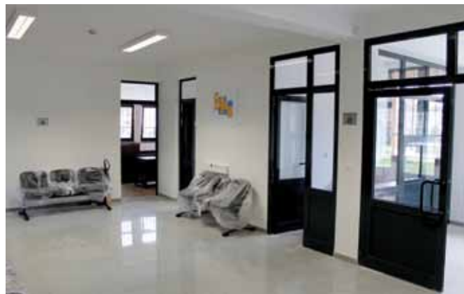
Hol - prizemlje