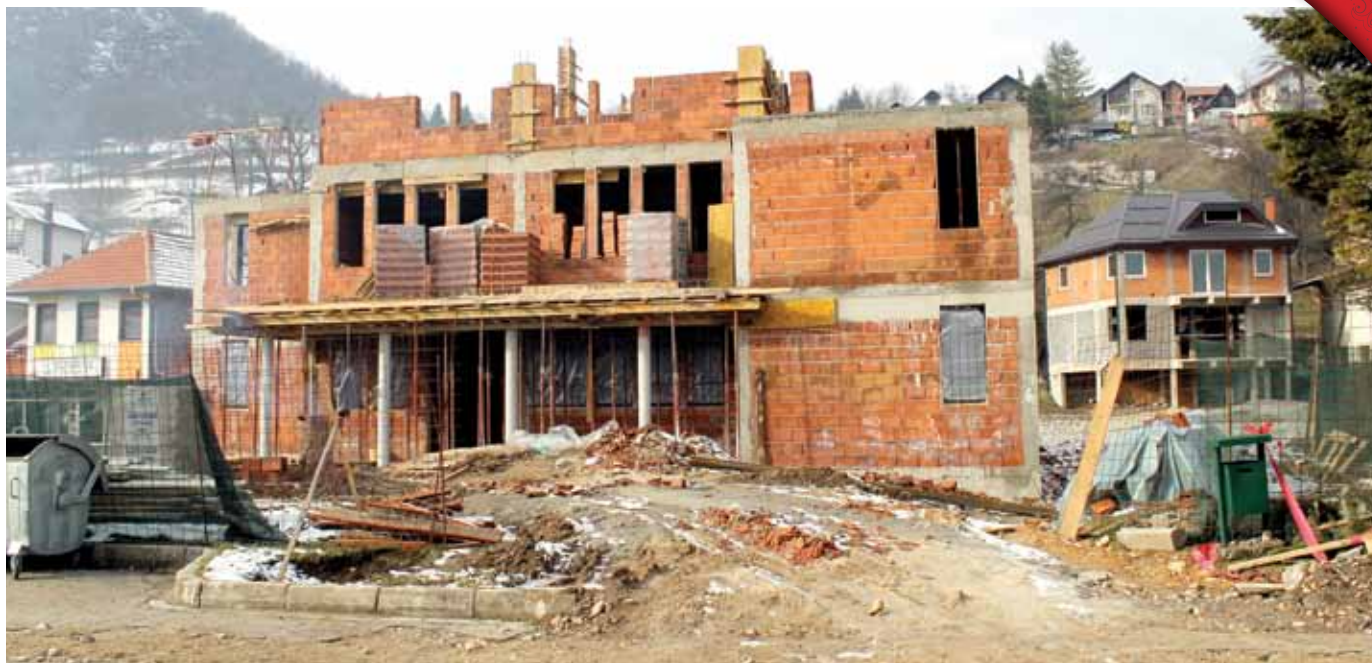
Zgrada suda u izgradnji