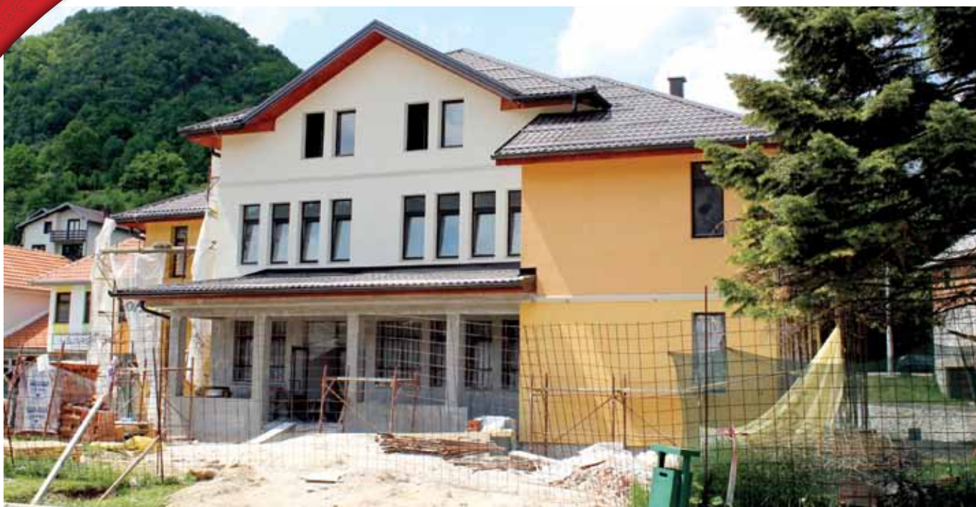
Zgrada suda u izgradnji