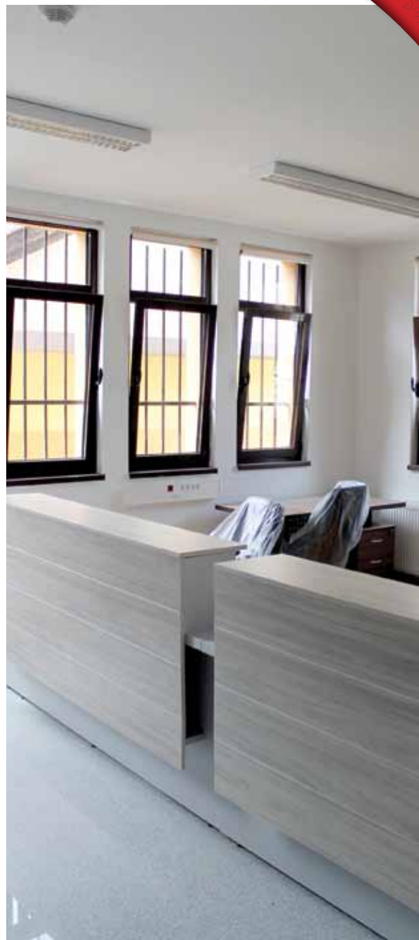
Zemljišno - knjižni ured