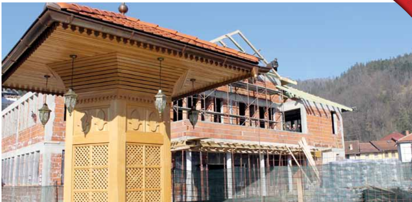
Zgrada suda u izgradnji