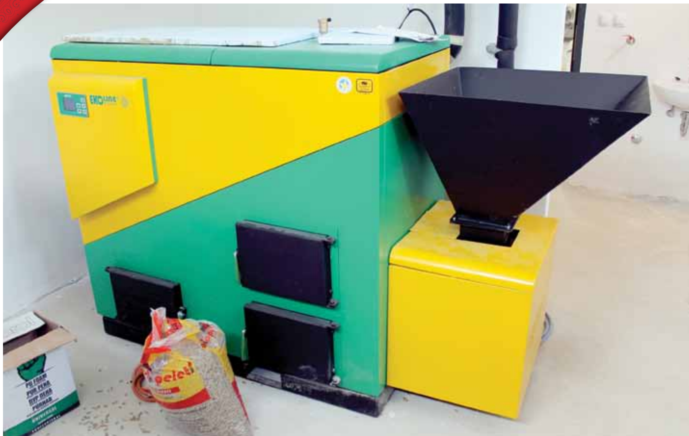
Kotlovnica - peć na pelet