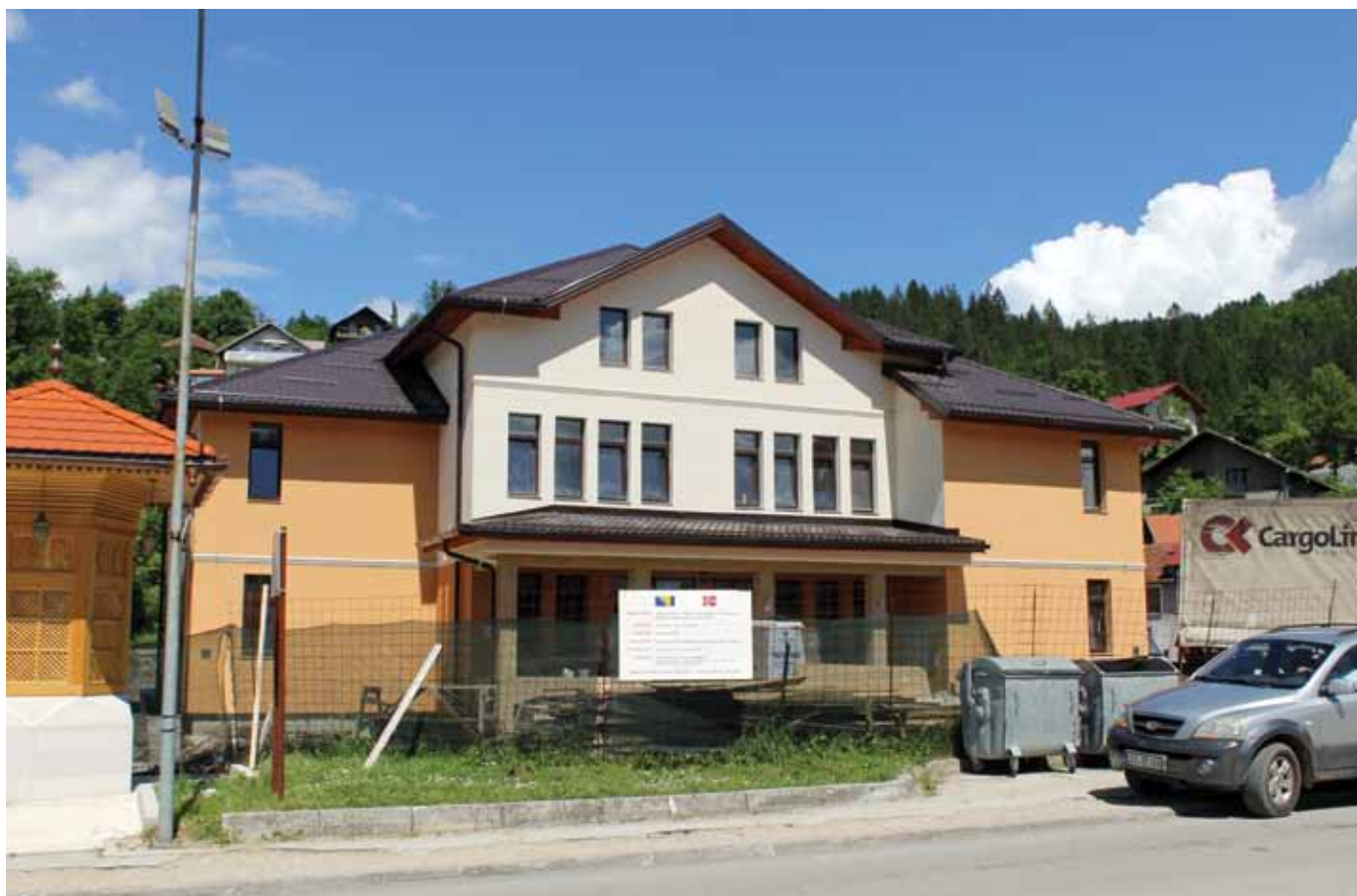
Zgrada suda u izgradnji

organiziranog prostora. Dobilo je savremenu pisarnicu i arhivu, dvije moderne sudnice, nove sudijske urede, infrastrukturu predviđenu za osobe sa invaliditetom, novu pritvorsku jedinicu u sklopu prostorije Sudske policije, a kompletan prostor je opremljen novim namještajem. Također, Sud je dobio energetske efikasnu zgradu zahvaljujući dobroj stolariji, termoizolacijskoj fasadi, termoizolacijskom krovu i novom energetski efikasnom sistemu grijanja zgrade na pelet, koje je ujedno i ekološki prihvatljivo. Zgrada Suda predana je na korištenje sudijama i drugim uposlenim, a građani mogu očekivati kvalitativno pružanje usluga.