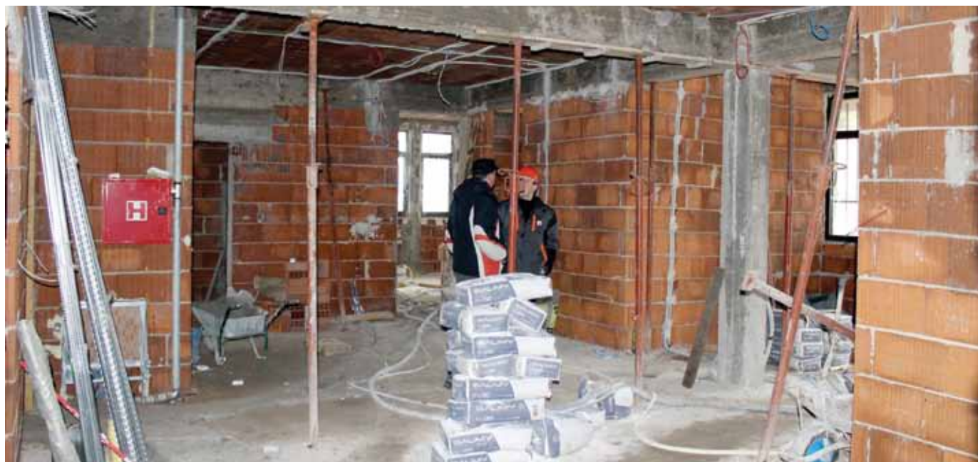
Hodnik - prizemlje