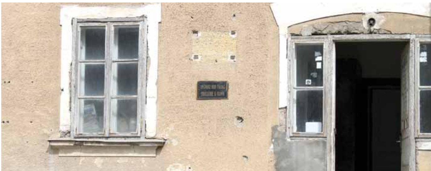
Stara zgrada - ulaz