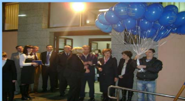
“Dani otvorenih vrata suda” 23.-24.10.2009. Kantonalni sud Novi Travnik