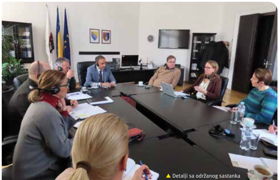
▲ Detalji sa održanog sastanka

Kako je prepoznata potreba za efikasnije pristupanje rješavanju izvršnih predmeta i naplati dugovanja, naglašeno je da su kapaciteti Odsjeka sudskih izvršitelja u prethodnom periodu znatno ojačani raspisivanjem i uspješnom provedbom konkursne procedure za upošljavanje 10 novih sudskih izvršitelja te je planirano jačanje kapaciteta „Call centra“ koji već u dosadašnjem radu bilježi kvalitetne rezultate i pozitivnu kritiku građana. Osim uspostavljenog „Call centra“, planirano