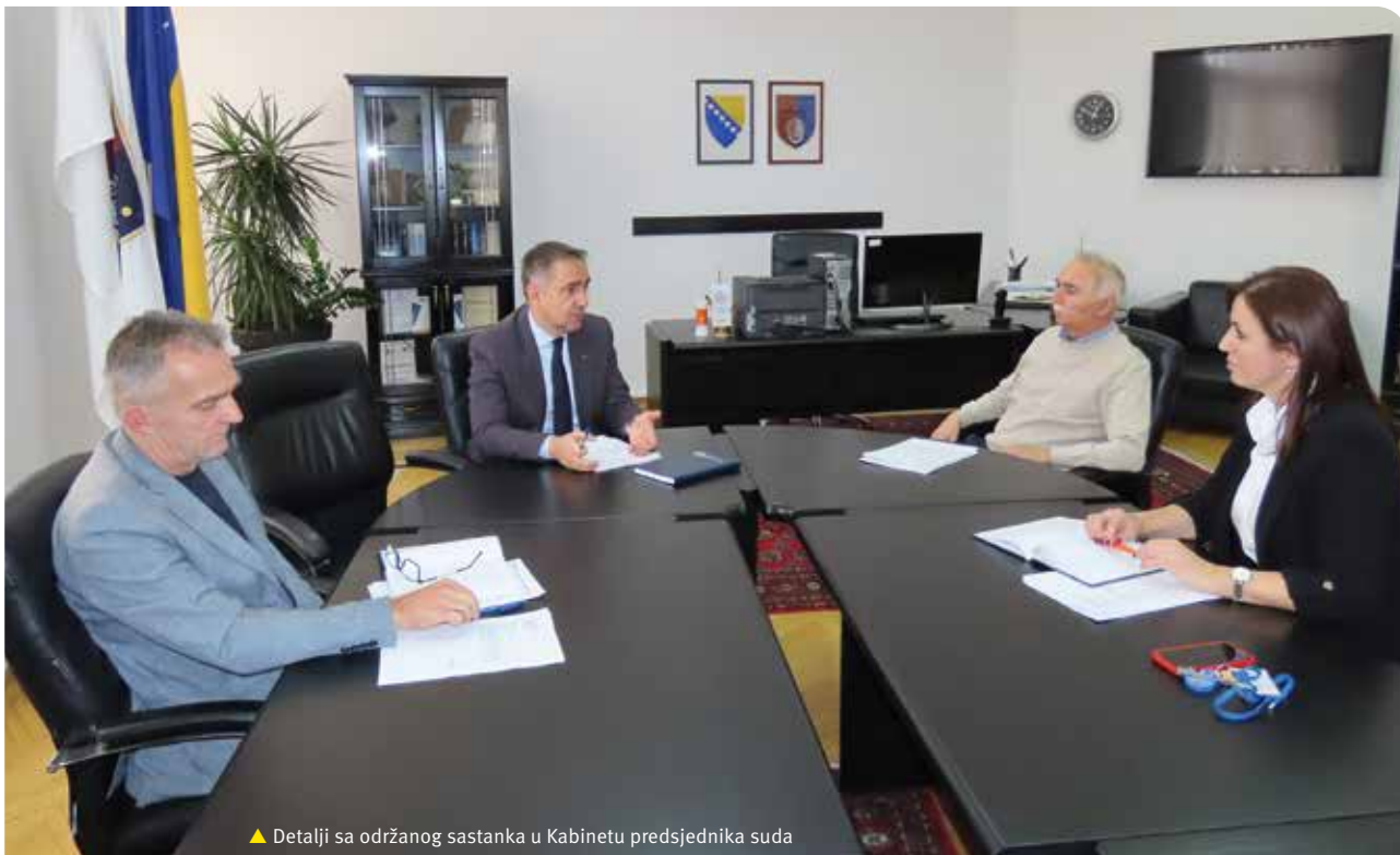
▲ Detalji sa održanog sastanka u Kabinetu predsjednika suda